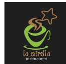
LA ESTRELLA RESTAURANTE