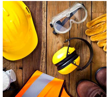
Suministros en General