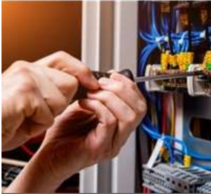
Instalaciones Eléctricas del Sector Industrial, Residencial y Comercial