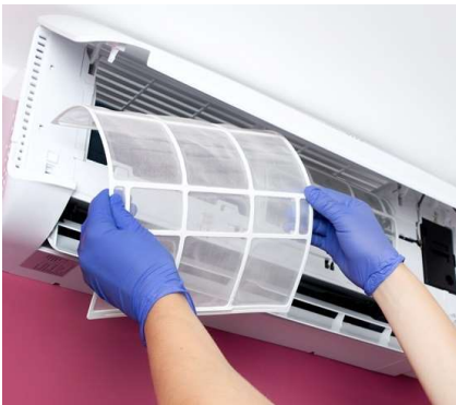
Servicios de Mantenimiento Preventivo y Correctivo a Sistemas AC/Mini Split