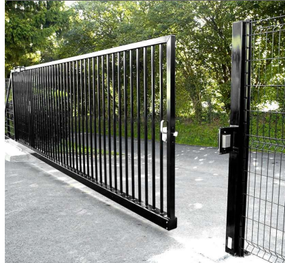
Servicios de Estructura Metálica