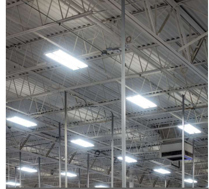
Servicios de Iluminación Interior y Exterior