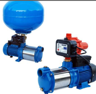
Servicios de Mantenimiento Preventivo y Correctivo en Asistencia de Presión Constante